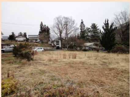
寮南面の畑 (今は荒れ地ですが・・・)