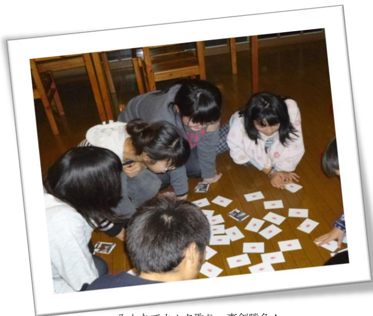
みんなでカルタ取り。真剣勝負！

※2回の見学会も、皆さまからのご支援を福島からの交通費の補助などに充てさせていただきました。