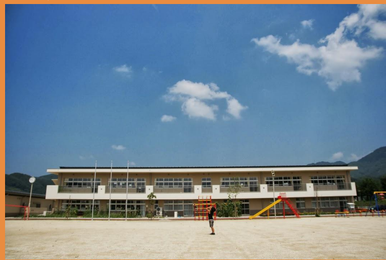
四賀小学校 校庭にて