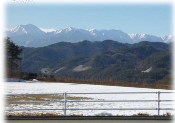
会田中学校校庭から望む北アルプス