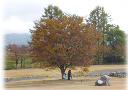
安曇野ちひろ美術館 前庭

最終日、お母さんたちが地元の産直所で信州産のお米や野菜をたくさん買って帰る姿も見られましたよ。