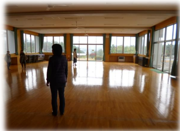
会田中学校内見学中。美しい学校です。

実際に松本を訪れてもらったことは、新しい生活へ向けて一歩を踏み出すための、大きな原動力となりました。